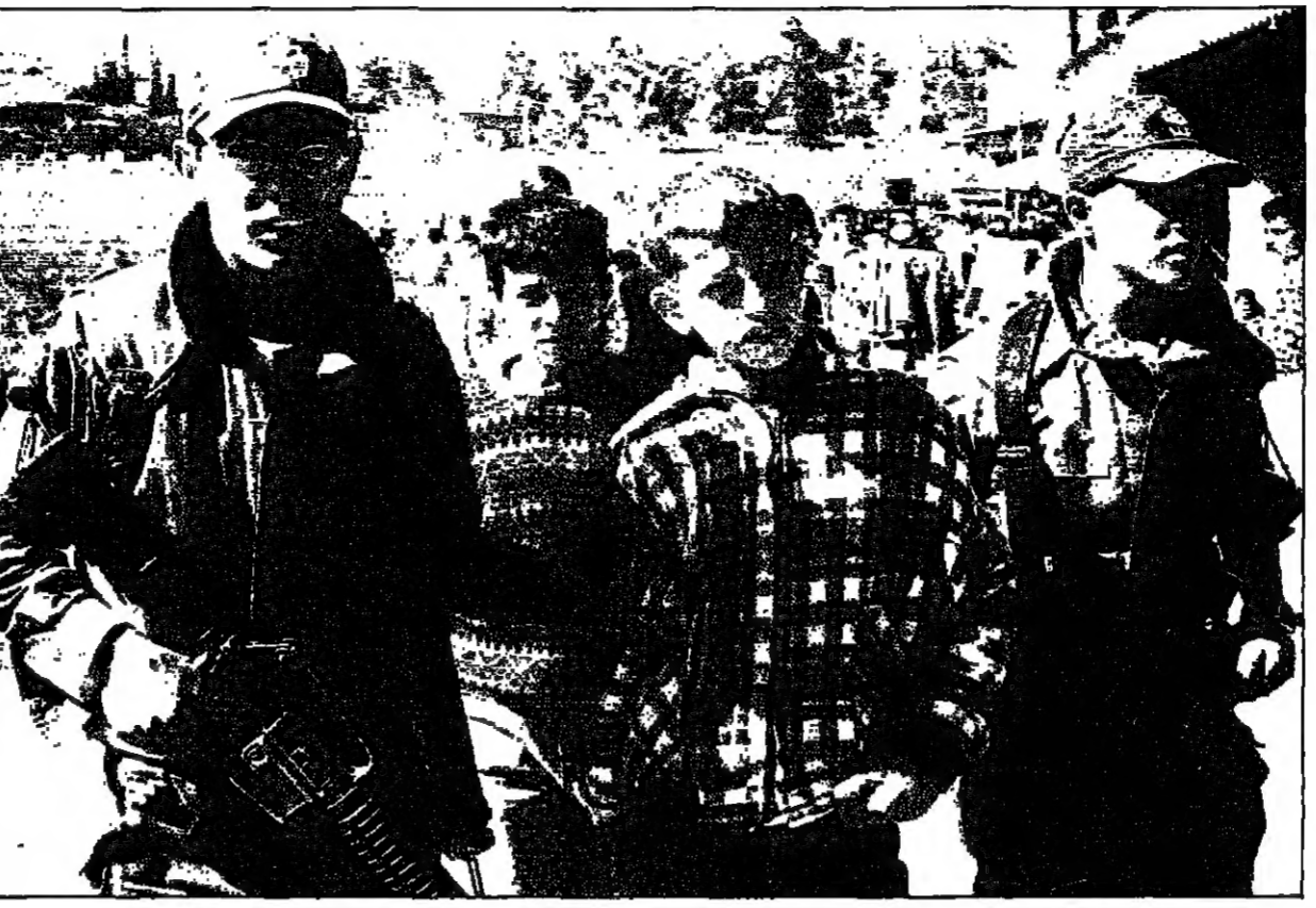
جنود إسرائيليون يحتفلون بسيما في مدينة الخليل

واشنطن - القدس العربي - من محمد دلج دمشق - من عصام حمزة قام وزير الدفاع الإسرائيلي محمد فورو زاده الجمعة بزيارة للجانب السوري من مرتفعات الجولان التي تحتلها إسرائيل. وقد ساعدته بلاده دمشق في توجيهها مع إسرائيل. في الوقت الذي أظهر فيه رئيس الوزراء الإسرائيلي بنيامين نتانياهو في واشنطن استعداداً كبيراً بوقفه من المفاوضات مع سورية، كما حذر من صواريخ بالستية بوفرة سريعة جداً، وبعث الولايات المتحدة إلى المساعدة لوقف انتشار هذه الأسلحة.